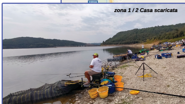
zona 1 / 2 Casa scaricata

profondità media: da 80 cm della Roubasienne ai 3m dell'inglese a 25 metri di distanza fine zona