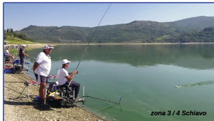
zona 3 / 4 Schiavo

profondità media: da 120 cm della Roubasienne ai 3,5m dell'inglese a 25 metri di distanza fine zona